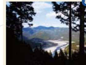
9 ひるしま 屋嶋 新宮市

日本一の落差を誇る、熊野那智大社のご神体とされる大滝。しぶきを浴びると延命長寿のご利益ありと伝わる。