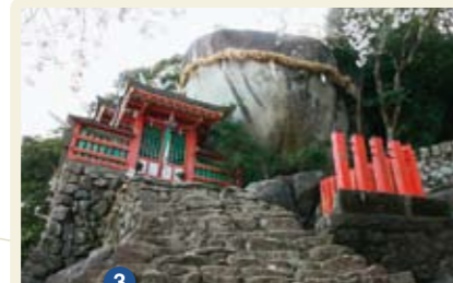
3 ごとびき岩 新宮市