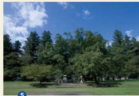
5 おおゆのはら 大斎原 田辺市本宮町