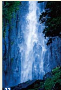
11 那智の滝 那智勝浦町

紀伊山地北部に源流を発生し、豊かな水をたたえて熊野灘へと注ぐ大河。両岸には山がせまり、点在する奇岩怪岩は「熊野権現の持ち物」と考えられ、様々な伝承が語られた。