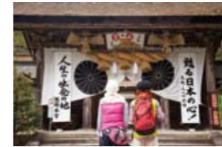
紀伊山地の霊場と参詣道