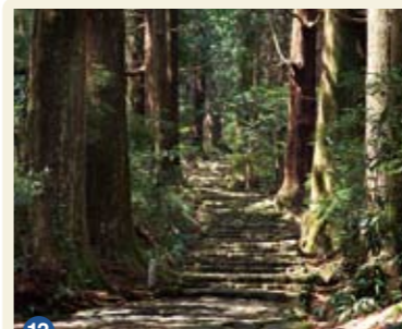
13 だいもんざか 大門坂 那智勝浦町