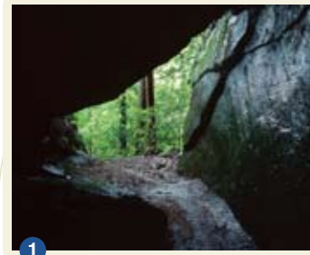
1 胎内くぐり 田辺市中辺路町

滝尻王子社を上がった古道沿いにある「胎内くぐり」とよばれる巨石。巨石のすき間をくぐれば「蘇る」といわれ、女性がくぐると安産になると伝えられる。近くには奥州藤原秀衡伝説が語り継がれる「乳岩」がある。