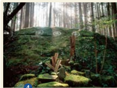
4 わろうだいし 円座石 新宮市:大雲取越

滝尻王子社を上がった古道沿いにある「胎内くぐり」とよばれる巨石。巨石のすき間をくぐれば「蘇る」といわれ、女性がくぐると安産になると伝えられる。近くには奥州藤原秀衡伝説が語り継がれる「乳岩」がある。