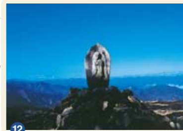
12 ひゃっけん 百間ぐら 田辺市本宮町:小雲取越