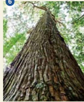
6 熊野速玉大社のナギの大木 新宮市

樹齢800年という10本ほどの巨木。枝はすべて那智山に向かって伸びている。明治の神社奉告令の際、南方熊楠の保護運動により守られた。